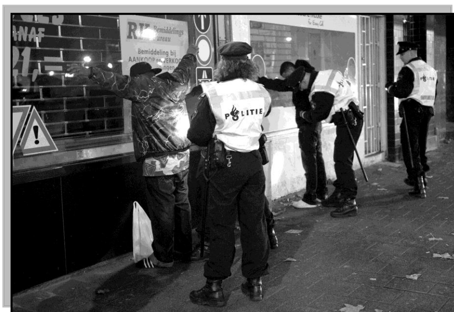
Preventief fouilleren in Rotterdam

Het Hof concludeert dat er sprake is van een onvoldoende gemotiveerde, geografisch en in tijdsduur onvoldoende gelimiteerde, voortdurende machtiging om publiek te onderwerpen aan een privacy schendende vorm van onderzoek en constateert dat er sprake is van onvoldoende toezicht op en rechtsbescherming van de burger tegen willekeurige inbreuk op zijn rechten. Het Hof vindt deze bepaling te ruim en daardoor in strijd met artikel 8 EVRM. Het Hof verlangt waarborgen tegen willekeur en vindt dat de noodzaak van preventief fouilleren moet worden gemotiveerd.