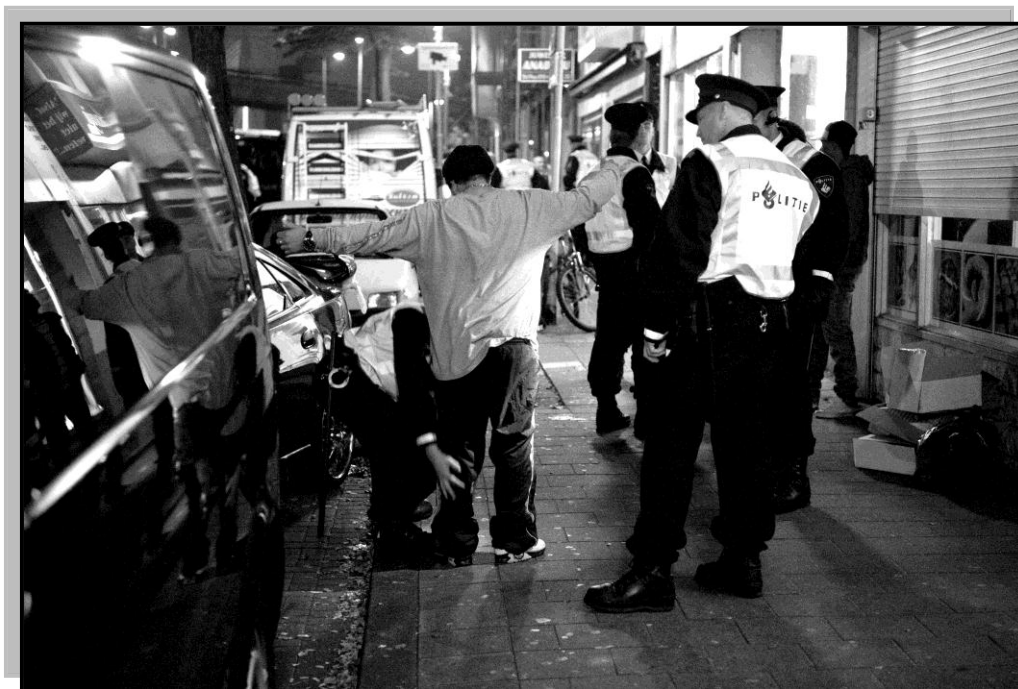
Preventief fouilleren in Rotterdam

De rechter bepaalde echter dat de aanleiding zoals de officier die benoemde, "er niet toe kan leiden dat een ieder die zich in dat gebied op het bewuste tijdstip op de openbare weg bevond, wordt aangemerkt als verdachte van een overtreding van de artikelen 13 en 26 van de wet wapens en munitie tegen die ernstige bezwaren bestaan" . De rechter stelde zich op het standpunt dat er sprake moest zijn van een geïndividualiseerde verdenking . De actie werd als onrechtmatig bestempeld. Deze actie en een andere actie in Amsterdam in december 1999, die ook als onrechtmatig werd bestempeld door de rechter, hebben uiteindelijk geleid tot het invoeren van de wettelijke bevoegdheid tot preventief fouilleren in 2002.