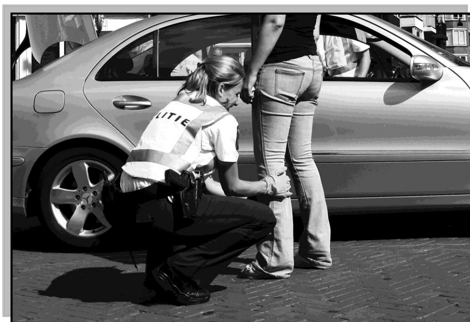
Preventief fouilleren in Amsterdam

Preventief fouilleren is een inbreuk op de persoonlijke levenssfeer en op de lichamelijke integriteit. Dit recht wordt beschermd door artikelen 10 en 11 Grondwet, artikel 8 Europees Verdrag voor de Rechten van de Mens (EVRM), en artikel 17 van het Internationaal Verdrag inzake Burgerrechten en Politieke Rechten (BUPO). Artikel 8 EVRM eist dat een inbreuk op dit recht met een aantal waarborgen moet zijn omkleed. In de eerste plaats moet er een wettelijke regeling zijn. Daarnaast eist artikel 8 EVRM ook dat de inmenging in een democratische samenleving noodzakelijk is in het belang van de openbare veiligheid, het voorkomen van wanordelijkheden en strafbare feiten en de bescherming van de gezondheid. Volgens jurisprudentie van het Europees Hof voor de Rechten van de Mens (EHRM) moet verder sprake zijn van een dringende maatschappelijke behoefte. De inbreuk op het privéleven moet proportioneel zijn in relatie tot het beoogde legitieme doel en de redenen die voor de beperking zijn gegeven, moeten relevant en voldoende zijn.