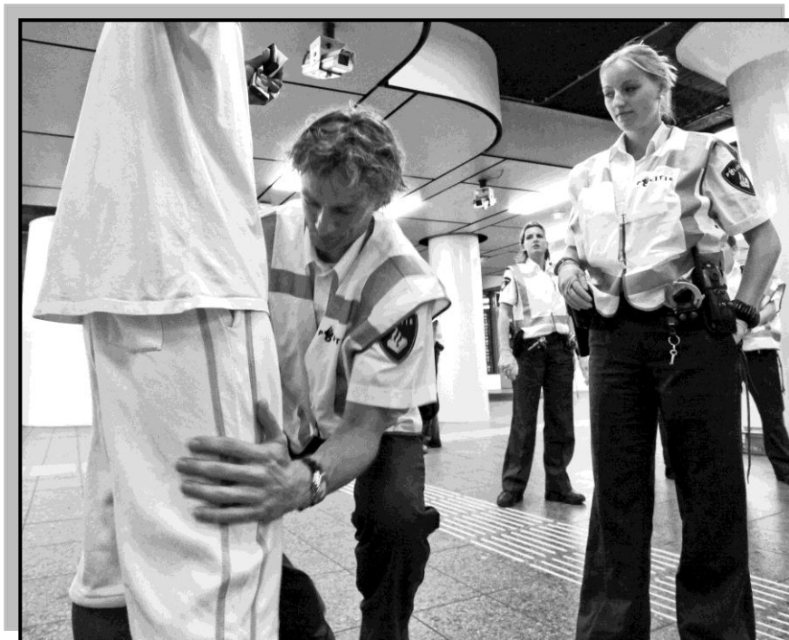
Preventief fouilleren in Amsterdam

Op Schiphol kregen gefouilleerde personen standaard een (Nederlands- of Engelstalige) informatiebrochure uitgereikt, terwijl dat in Amsterdam nog wel eens achterwege bleef. In Rotterdam waren informatiefolders niet op voorraad en was ook niet duidelijk wanneer aanvulling zou plaatsvinden.